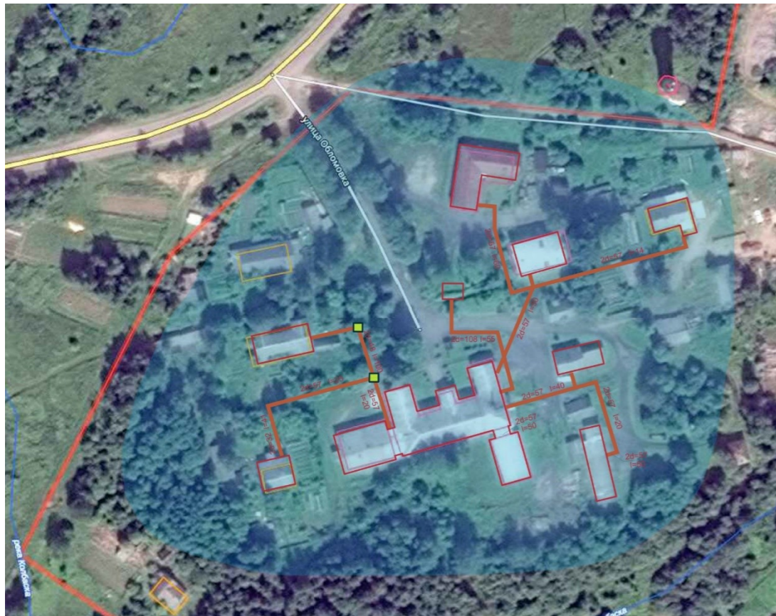
Рисунок 1.8 Схема тепловых сетей котельной ТГУ-350 с. Зарубино