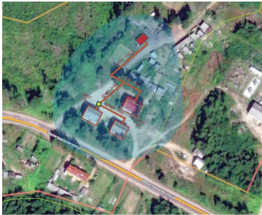
Рисунок 1.4 Схема тепловых сетей котельной №19 д. Большой Городок