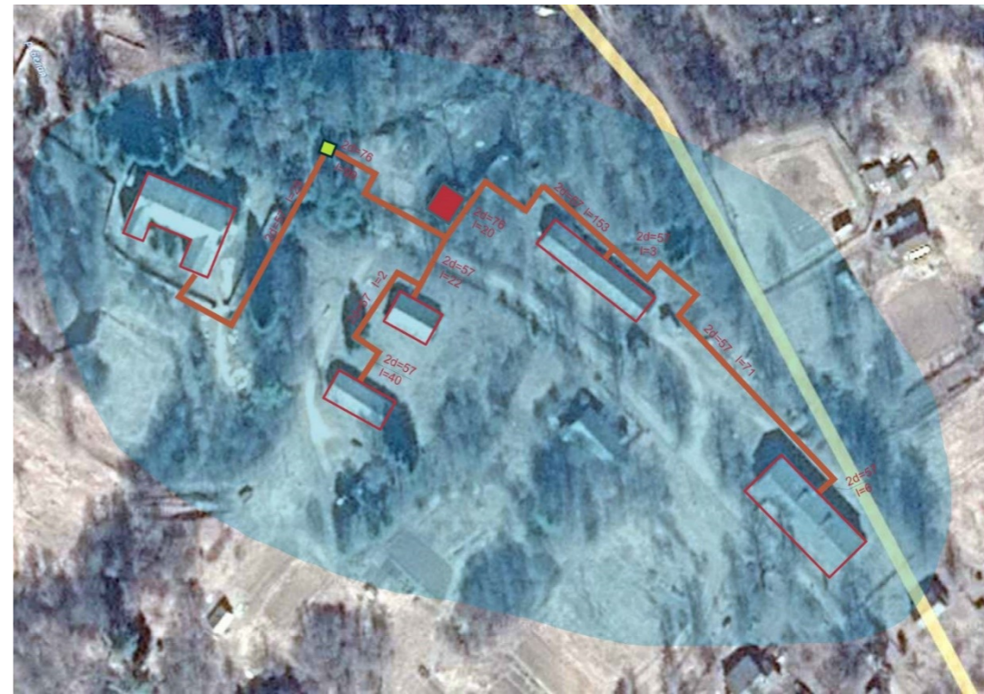
Рисунок 1.2 Схема тепловых сетей котельной №2 с. Шереховичи