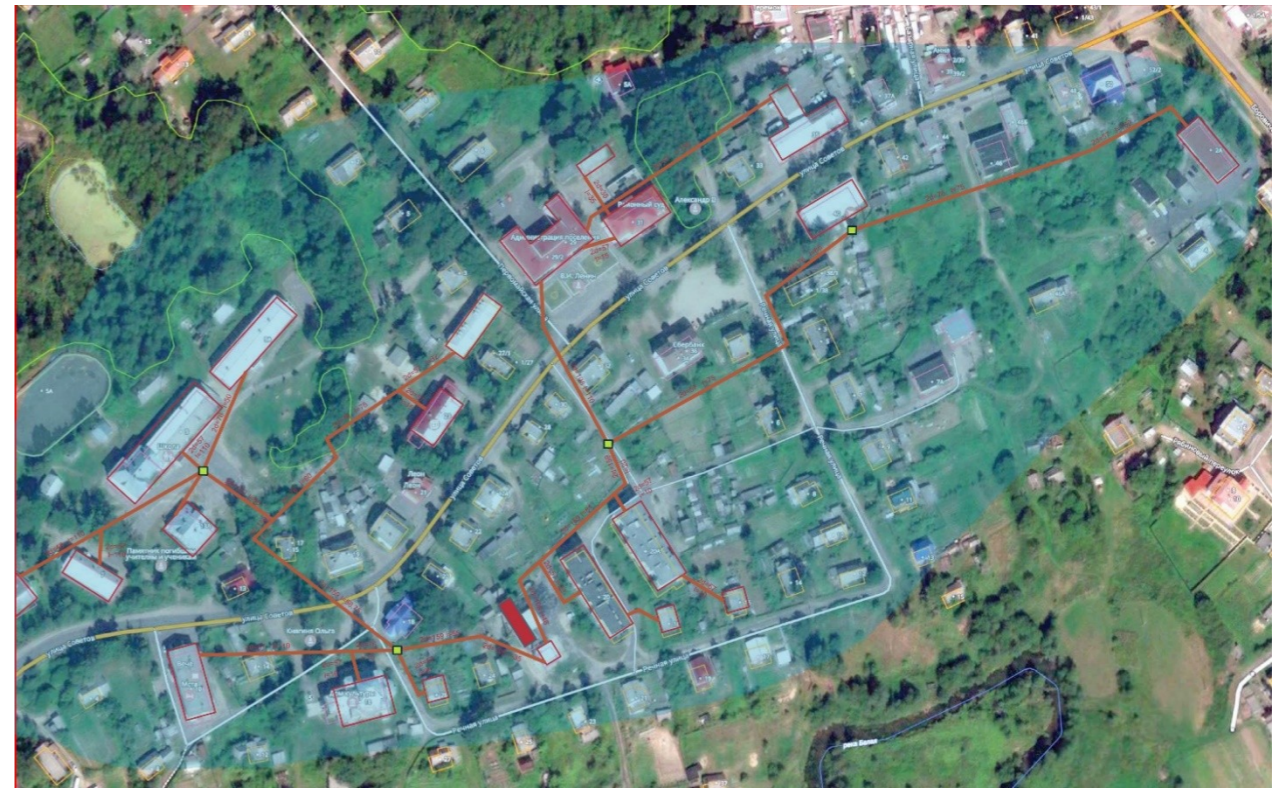
Рисунок 1.6 Схема тепловых сетей котельной БМК №2 п. Любытино