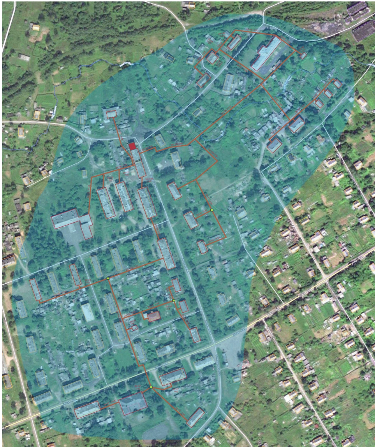
Рисунок 1.1 Схема тепловых сетей котельной 1,96 МВт с. Зарубино